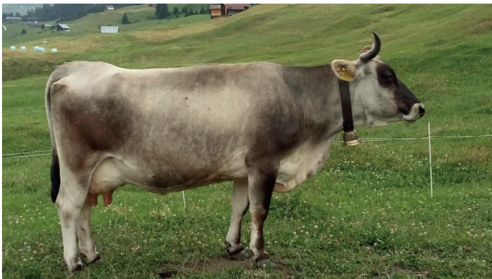
Gloria 2003 von Aldo Arpagaus, Cumbel.